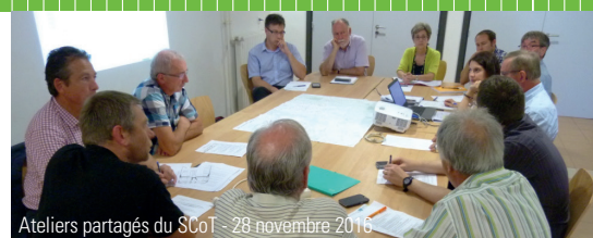
Ateliers partagés du SCoT - 28 novembre 2016

Président du PETA du Pays de Sarrebourg et du SCoT de l'Arrondissement de Sarrebourg